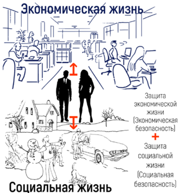
Рисунок 2. Содержание экономической безопасности