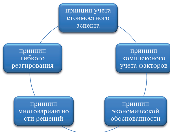
Рисунок 1. Принципы совершенствования системы управления организацией

В современном менеджменте финансовый аспект приобретает всё большее значение для стоимостного управления. Произошёл сдвиг от «бухгалтерского» к «финансовому» мышлению при принятии управленческих решений. Такая трансформация позволяет сместить фокус