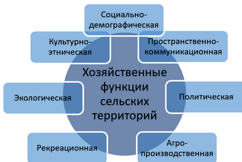
Рисунок 1. Хозяйственные функции сельских территорий

Вместе с тем, «жесткие» условия по выполнению планов и контроль за ходом их исполнения, выступающие как базисные постулаты долгосрочного планирования, привели к бюрократизации