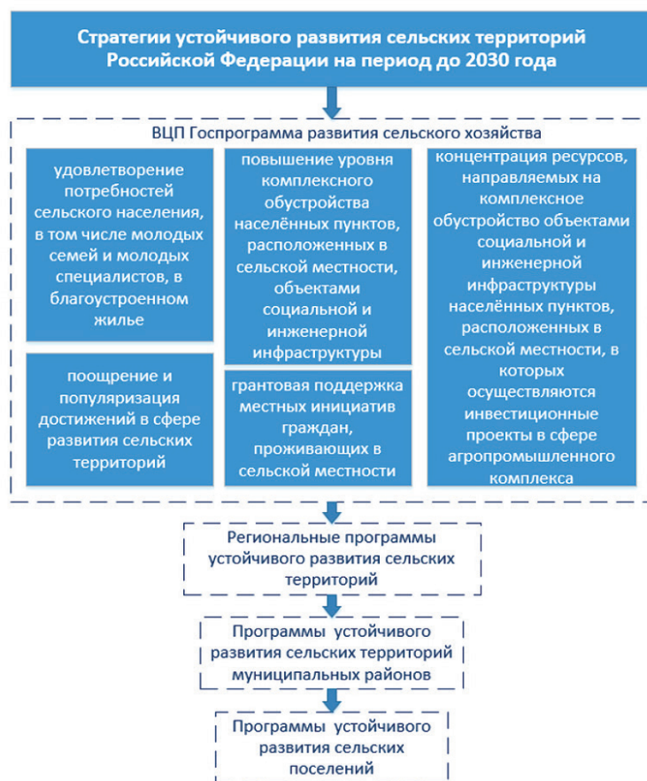
Рисунок 2. Система стратегического целеполагания долгосрочного развития сельских территорий

В связи с этим уменьшение уровневой иерархии приводит к уменьшению финансовых возможностей сельских территорий, что, в свою очередь, сокращает спектр решаемых задач. Учитывая это, нам представляется, что необходимо прекратить декларирование приоритетов развития сельских территорий федерального уровня как стратегических целей. Это даст возможность установить детализированные проблемы конкретных территорий, на решение которых и будут направлены стратегические документы.