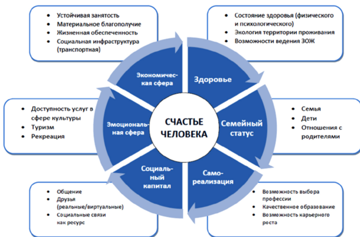
Рисунок 3. Структурно-графическая модель, объединяющая факторы, влияющие на восприятие человеком счастья

Рассмотренные в статье вопросы, безусловно, носят дискуссионный характер, и требуют дальнейшего исследования и обсуждения в научной среде. Предложенные авторами схемы и модели взаимосвязи групп факторов, влияющих на восприятие человеком счастья и измерение уровня благополучия, могут способствовать плодотворной научной дискуссии на страницах журнала.